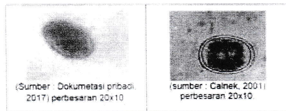
Gambar 1. Morfologi telur Ascaridia galli .

Hal ini sesuai dengan pernyataan Tabbu (2002) bahwa infeksi Heterakis oleh Heterakis gallinarum banyak dijumpai pada ayam, itik, angsa dan sejenis ayam hutan yang hidup pada lingkungan yang kurang bersih serta kelembaban yang cukup tinggi.